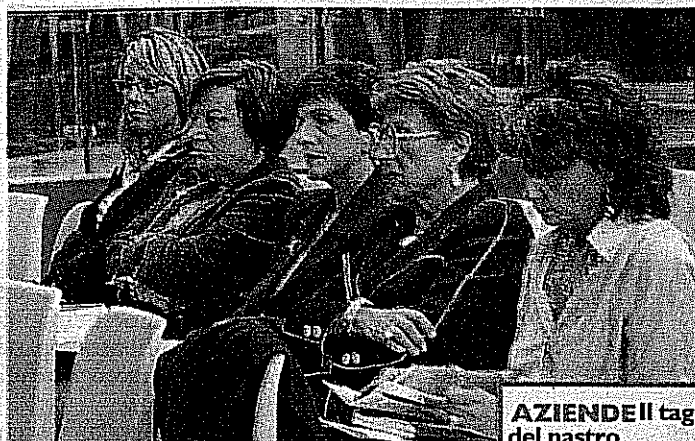
AZIENDE Il taglio del nastro a Speziaexpo'